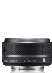
1 NIKKOR 11-27.5mm f/3.5-5.6

Presentata insieme alla Nikon 1 J2, la custodia subacquea WP-N1 consente a chi si dedica alle immersioni fotografiche di portare sott’acqua la Nikon 1 J1 o la Nikon 1 J2 ed ottenere immagini di alto livello a nuove profondità. Compatibile con l’obiettivo 1 NIKKOR 10-30mm f/3.5-5.6 ed in grado di scendere fino a 40 m sotto la superficie dell’acqua, la elegante custodia WP-N1 permette di utilizzare tutte le funzioni della fotocamera proprio come sulla terra ferma. Alla gamma 1 NIKKOR è stato inoltre aggiunto l’obiettivo zoom 2,5x 1 NIKKOR 11-27.5mm f/3.5-5.6. L’escursione focale da 11 a 27,5 mm consente di coprire le più comuni situazioni quotidiane, mentre il design compatto permette di lasciare l’ottica innestata nella fotocamera e di riporre facilmente il tutto in tasca o in una borsa. E quando il momento memorabile da fotografare o da filmare arriverà, sarà sufficiente ruotare l’obiettivo per accendere la fotocamera e ritrarlo per spegnerla.