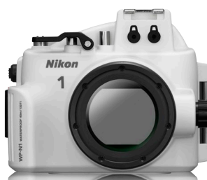
Custodia subacquea WP-N1